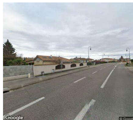
Vue STREET VIEW du secteur